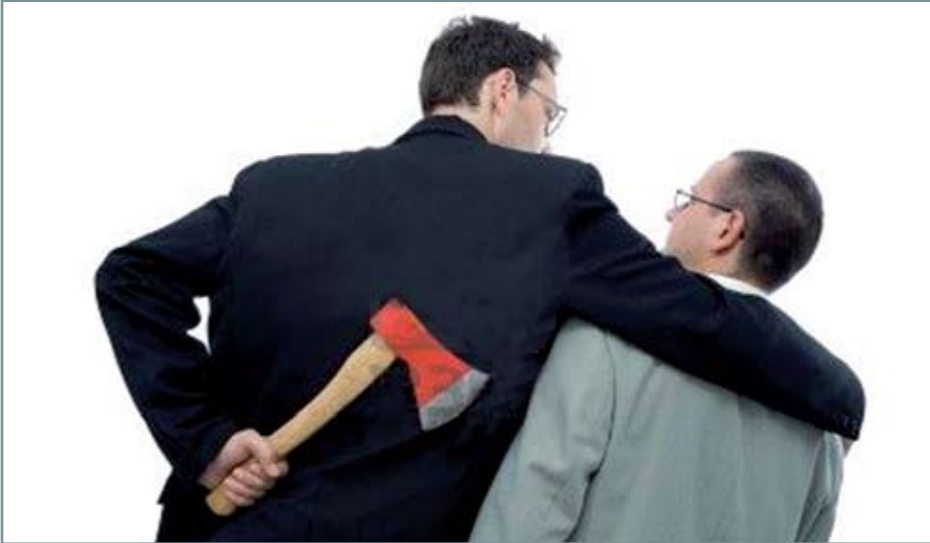
Les options dans l'action en entreprise ne se résument pas à se confier en Dieu et à ne rien faire, ou à foncer en jouant de la trahison.

avec une communauté composée uniquement de gens au tempérament contemplatif car les gens d'action auront toutes finies par prendre le large!