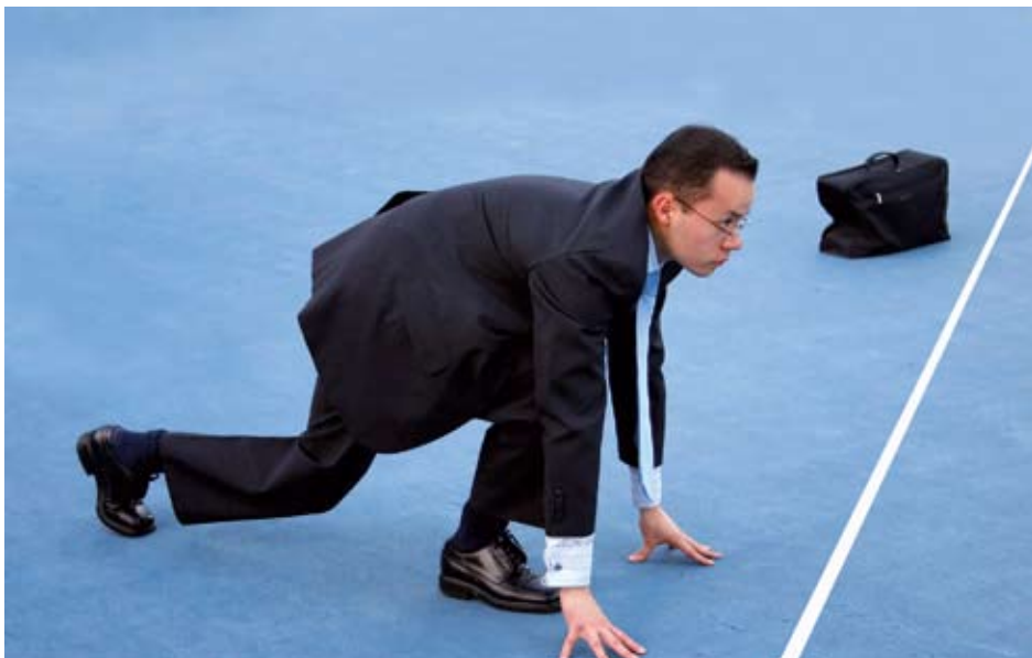
Le processus d'embauche est semblable à un départ de sprint pour l'employé.

par Mark Russel 1 . Ce livre recèle de nombreuses anecdotes dont celle d'un pdg d'une entreprise manufacturière qui était au bord du gouffre à cause du surendettement. La compagnie devait de l'argent à pas moins de 230 fournisseurs différents! La banque avec qui l'entreprise avait une marge de crédit l'incitait à déclarer faillite.