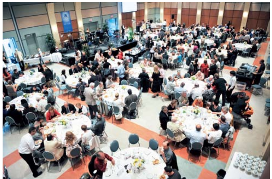
Le banquet du samedi soir