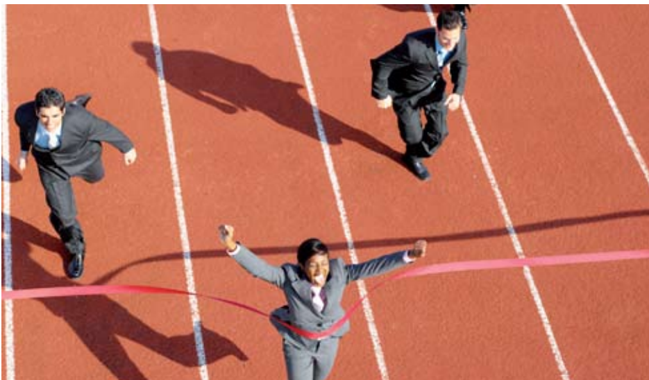
La personne la plus à même de faire le travail devrait accéder au poste affiché.

de manière à m'assurer que, dès le départ, nous arrêtons notre choix sur les bons candidats pour les postes que nous avons à combler. On peut dire que cette façon de faire a été ma manière d'appliquer la règle d'or. En effet, pour ma part, si j'étais celui qui était à la recherche d'un emploi, je détesterais être embauché pour un travail que je n'arriverais pas à exécuter de façon satisfaisante!