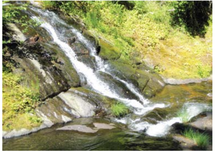
Une rivière a besoin d'un lit profond et de bonnes balises pour accueillir de nouveaux affluents.