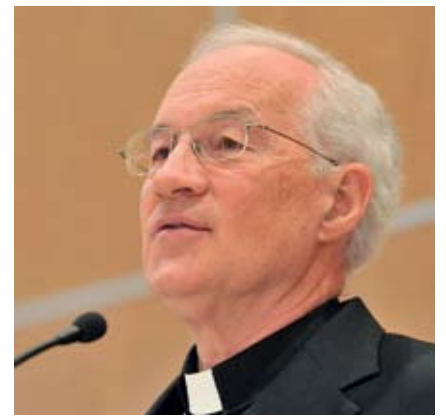
Le cardinal Ouellet de la ville de Québec

fait partie de ces clercs carriéristes qui semblent n'avoir jamais apprécié la brise venant de la petite fenêtre qu'est Vatican II... Mine de rien, en plaçant SES hommes à la tête des différentes Églises locales, il contribuera FORTEMENT à cléricaiser les communautés chrétiennes, à renforcer les rituels et les normes au détriment de la Parole de Dieu... Lui qui, durant son passage à Québec, n'a pas réussi à s'intégrer à l'Assemblée des Évêques Catholiques du Québec, aura maintenant beau jeu pour poursuivre l'affaiblissement des con-