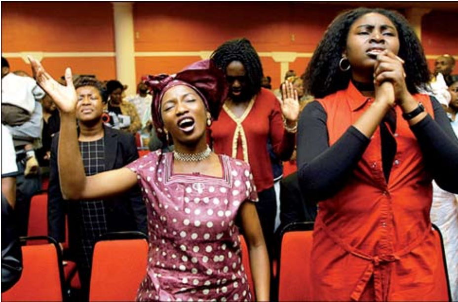
L'église est appelée à devenir une vraie communauté

L'absence de directives précises est largement compensée par plusieurs textes qui font référence à des principes directeurs qui se présentent à nous comme des boussoles capables d'orienter notre vie communautaire. Penchons-nous maintenant sur trois de ces principes. Le premier principe concerne la primauté de la communauté. Paul, pour ne parler que de lui, voit la communauté comme étant un des éléments centraux du dessein de Dieu. La force de frappe des images qu'il utilise nous l'indique clairement : l'Église est « le corps du Christ » ; ailleurs il en parle comme étant « le temple que Dieu habite par l'Esprit », etc. Étant donné cette participation intime à la vie divine, avec tout ce que cela suggère en termes de solidarité,