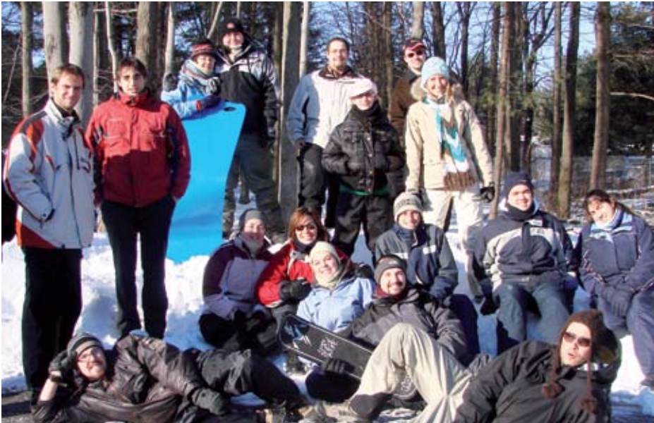
Les églises doivent s'inspirer de Jésus si elles veulent atteindre les jeunes adultes urbains

alors qu'il travaillait à temps plein pour Mission urbaine , un organisme catholique à but non lucratif dont le mandat consiste à chercher à connaître et à rejoindre les jeunes adultes. Pendant deux ans, il a pris contact avec quelque 1600 jeunes adultes de 18 à 30 ans de l'arrondissement de Sainte-Foy, à Québec. Il les a rejoins dans leurs lieux de loisirs, soit les bars, les cafés, les discothèques, les salles de billard et les restaurants. Environ le tiers des témoignages qu'il a recueillis répondait directement à la question qu'il avait choisi d'étudier, soit la présence de liens entre la démarche spirituelle des 18-30 ans et les valeurs chrétiennes. Le nombre élevé d'interviews et d'échanges sur lesquels se base son travail lui confère une importance tout à fait exceptionnelle. Grâce à ce très vaste échantillon, cette thèse de doctorat nous donne