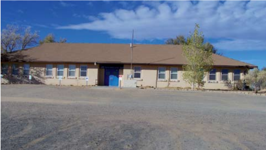
L'école de la réserve bâtie en 1951 par des missionnaires

ces difficultés, les Hopi sont des gens très sympathiques qui aiment partager et qui se soutiennent mutuellement. La famille proche et élargie revêt une grande importance. Régulièrement, ils organisent des événements qui impliquent toute la communauté. La culture Hopi est très différente de la culture québécoise. Ainsi par exemple, on peut rendre visite à n'importe qui à n'importe quel moment. Le temps n'a pas d'importance; on peut arriver plus tard à un rendez-vous et être tout de même bien reçu.