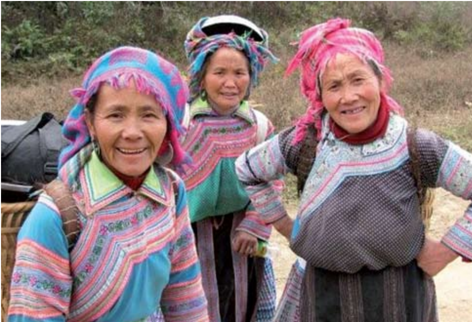
Ces trois paysannes chinoises nous rappellent que 700 millions d'habitants de ce pays vivent de la terre

à leurs propres fins. Ainsi, les gouvernements qui se succèdent présentent à peu près toujours leurs politiques comme étant « durables » ou « vertes », alors qu'elles ne le sont vraiment que dans de trop rares cas. Mentionnons aussi la manière honteuse avec laquelle de nombreuses entreprises commerciales s'approprient le terme «écologique» afin de l'accoler à des produits qui n'ont de vert que la barre colorée qui décore leur emballage. Cette pratique détestable a été baptisée du nom de greenwash par les américains. Retenons ce terme, car nous n'avons pas fini d'en subir du greenwash ! Mais ce n'est pas tout. Nos médias colportent aussi souvent les délires de ces technomanes (cousins pas