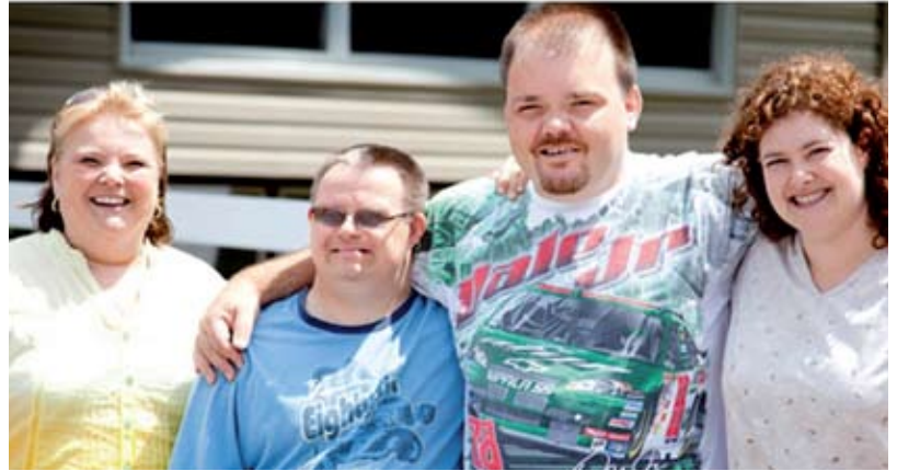
Christian Horizons a été la pionnière en Ontario dans la création de foyers pour héberger des personnes handicapées.