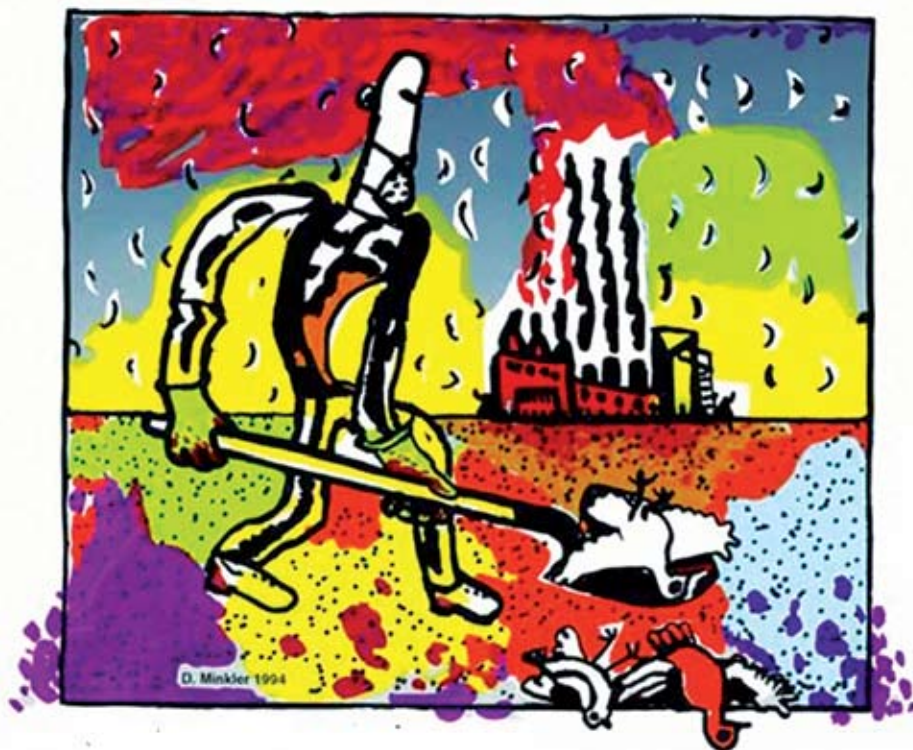
Corporation: Dispositif ingénieux visant à l'enrichissement individuel tout en évitant la responsabilité individuelle. Ambrose Bierce 1842-1914

prêtant attention. Ce n'était que le bruit de fond d'un processus « libérateur ». C'était jusqu'à « hier ». Jusqu'à ce que parmi ceux-là même qui alimentaient le « rêve américain » par leurs voix rassurantes, s'élèvent en chœur des voix de Cassandre prédisant des catastrophes si rien n'était fait à brève échéance pour contrer les dégâts du « progrès ». Le réveil est brusque et peut même s'avérer cauchemardesque. Le partage légitime de l' American way of life par l'Inde et la Chine, soit le tiers de la population mondiale, révèle le mensonge de cette manière de vivre: elle n'est pas pour tous, loin