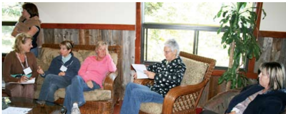
Retraite de femmes au camp Porteurs du flambeau à Chertsey