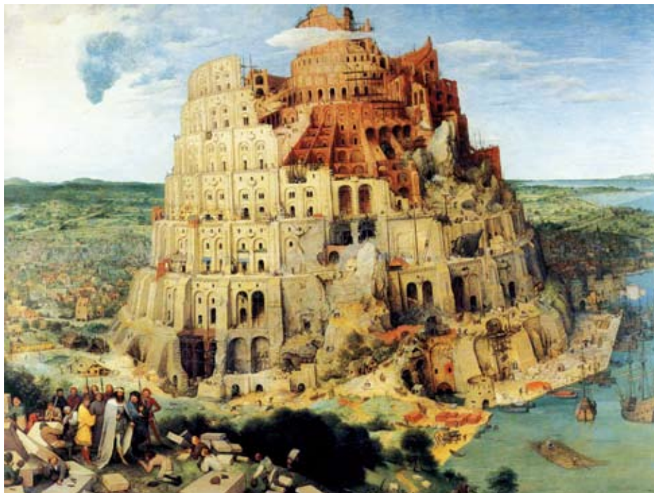
La tour de babel par Brueghel l' Ancien

proche chrétienne des phénomènes écologiques, une approche qui appréhende ces phénomènes en tenant compte des relations établies entre ces trois entités : le Créateur, la nature et l'homme. Donc malgré qu'elle nous vienne d'une époque où la conscience écologique n'existait pas, la Bible nous fournit le concept clé pour orienter notre réflexion.